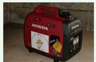
インバーター発電機