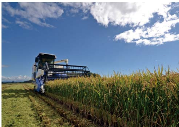
当別町の農作業風景

当別町単独で声を上げても効果が薄いと思われるので、今までと同じように各農業関係機関と足並みをそろえ、町村会も含めて、希望の持てる農政となるよう国に対して要望していく。