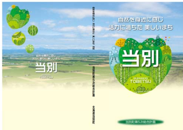
当別町第5次総合計画

も加味し、8月頃に素案をまとめる。その後、総合計画審議会へ諮問をし、またパブリックコメントを実施した上で審議会からの答申を受け、2020年3月までに策定する。