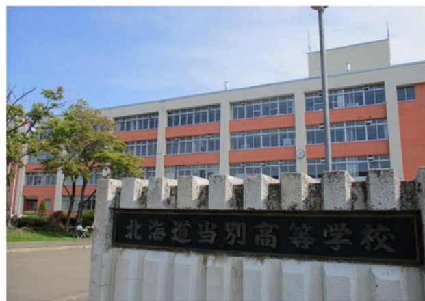
北海道当別高等学校

答 現段階で言えることは、生徒や保護者から選ばれる学校になるためにどのような支援やあり方が望ましいのかを高校とともに考えていきたい。