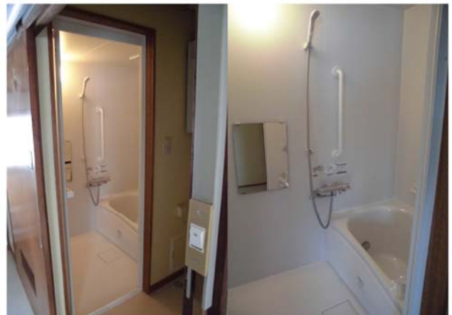
東町団地に設置したユニットバス