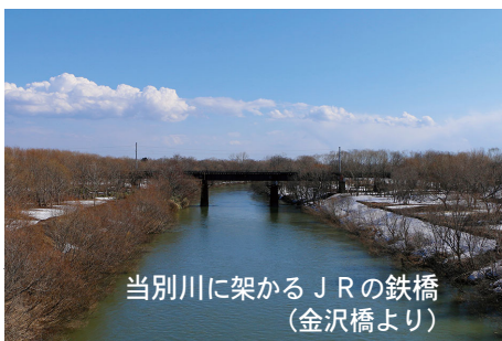
当別川に架かる J R の鉄橋 (金沢橋より)