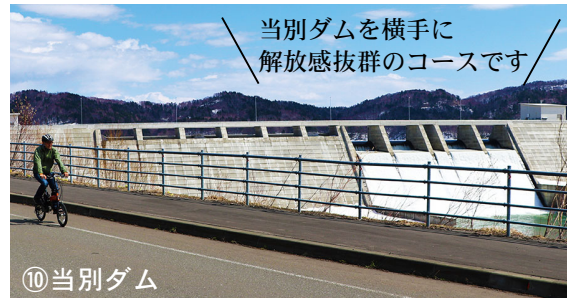
当別ダムを横手に 解放感抜群のコースです！