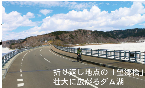
折り返し地点の「望郷橋」 壮大に広がるダム湖