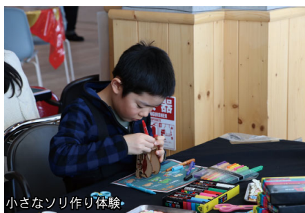
小さなソリ作り体験