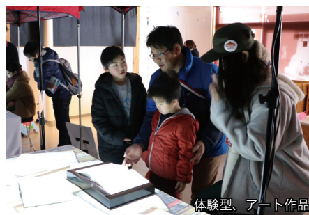
体験型、アート作品