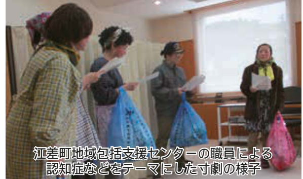
江差町地域包括支援センターの職員による認知症などをテーマにした寸劇の様子

知内町ではバイオマス産業都市構想の取り組み、江差町では地域包括ケアシステム及び医療・介護連携の取り組みについて視察を行いました。(知内町・江差町)