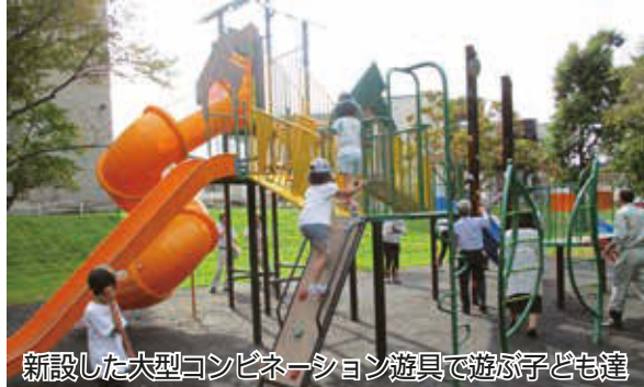
新設した大型コンビネーション遊具で遊ぶ子ども達

水稻や大豆のほ場を視察し、生育状況などについて調査しました。また、道路改良工事が予定されている町道や阿蘇公園に新たに設置された大型コンビネーション遊具の視察も行いました。