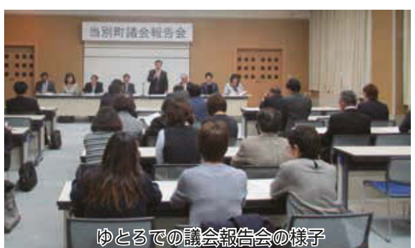
ゆとろでの議会報告会の様子

農業・商工業団体を対象に、12日はゆとろ、13日は西当別コミュニティーセンターで議会報告会を開催しました。詳細は、平成31年2月発行の議会だより第196号に掲載する予定です。