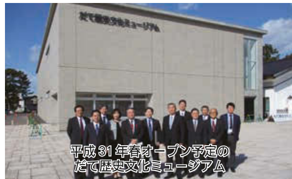
平成31年春オープン予定のだて歴史文化ミュージアム

新ひだか町では新ひだか町創生総合戦略、伊達市ではだて歴史文化ミュージアムについて視察を行いました。(新ひだか町・伊達市)