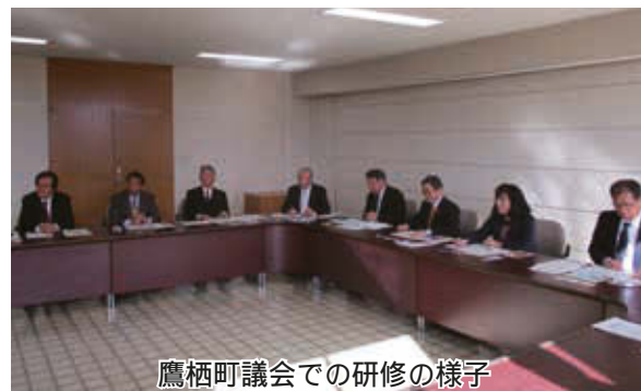
鷹栖町議会での研修の様子

美唄市ではコンパクトシティ構想(立地適正化計画)、鷹栖町では立地適正化計画について視察を行いました。(美唄市・鷹栖町)