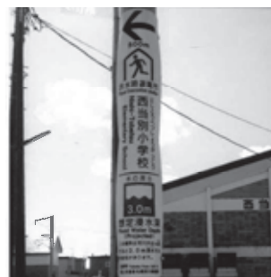
想定浸水深とハザードマップの相違