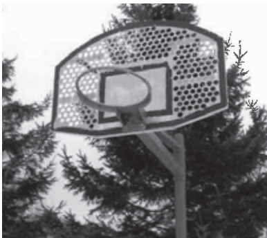
公園のバスケットゴール

あいあい公園、ゆうゆう公園には、パークゴルフ場やサッカー場があり、地元住民はもちろん、町外からも多くの人々が利用しているが、両公園とも入口に設置されているバスケットゴールネット網がボロボロで放置され、何ともみすばらしい。また、白樺緑地の休憩施設が長い間壊れ放置され、折角の自然が残っている緑地（公園）が台無しである。さらに、太美スターライト北の基線側防風林の短歌掲示板も壊れ放置されている。地元の主婦や農業従事の婦人の素敵な短歌がたくさん掲示されていたのに、今は3分の1も残っていない。これらの対応について伺う。