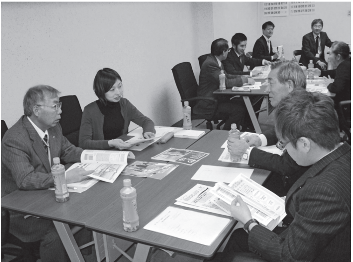
他町村の議会だよりも参考にございました（第1回モニター会議）【12月6日】