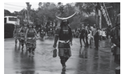
当別町140年記念事業の様子

教育長 町史編纂に係る資料収集については、社会教育課が広く歴史的資料の収集を行っている。合わせて大崎市との連携協力のもと、古文書の解析に取り組んでいるところである。その資料が町史編纂に活かされるものと認識している。次に、郷土愛をはぐくむ教育について、ふるさとへの誇りや愛着を持つことは、人として基本的なことであると考えている。ふるさとというのは、人が心のよりどころとする大切な所である。学校の教育活動全般を通して郷土愛を育むべきであると考えている。