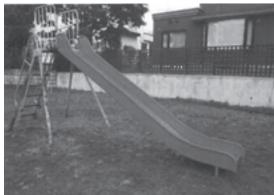
滑走面のフレームを取替えたもみじ広場の滑り台