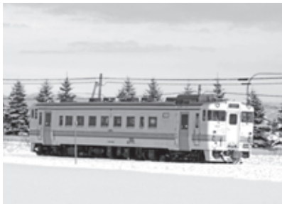
当別町金沢を走る汽車

町長 今年の 4 月 21 日に、沿線 4 町の町長、北海道の交通担当局長、石狩・空知の両振興局長が出席し、JR 北海道から現状について説明を受け、その後、JR 北海道を除いたメンバーで意見交換を 6 回行った。この会議では、当別町としての考え方を提示し、その実現可能性について協議してきたが、4 町の事情は必ずしも同じではないということが見えてきた。このような中、報道等では若干誤った内容の記事があったところであるが、11 月に開催された直近の会議において、4 町のスタンスは路線存続であるが、それぞれの町で、バスを含めた最適な公共交通のあり方についても、研究を進めていくことを確認した。