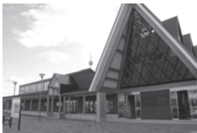
北欧の風 道の駅とうべつ

○ドライバーより、テイクアウトの商品をもう少し安く量を多くして欲しい。ラーメン、カレーライスを期待している。