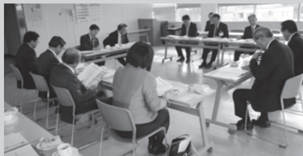
倶知安町議会での研修の様子