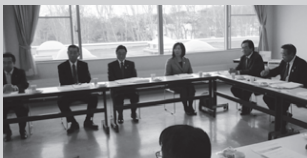
白老町議会での研修の様子