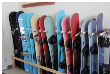
スノーボードもいろいろと そろえられています