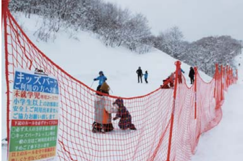
ネットで仕切られ未就学児が安全に利用できるキッズパーク

ロッジのすぐ隣に今シーズンから設置された未就学児専用の練習場のキッズパークは、レッスン時以外は自由に利用できます。一般のス