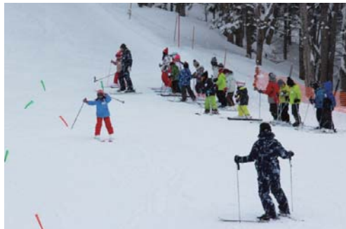
小学生のレッスンの様子