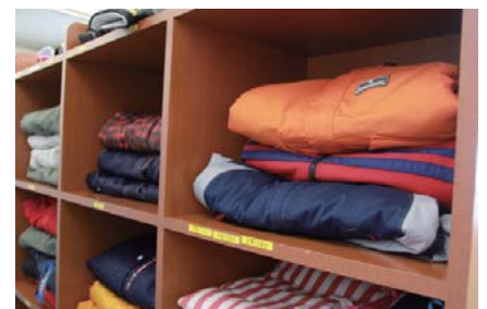
さまざまなデザインのウェア があります