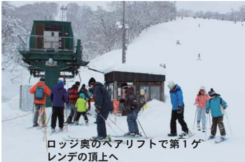
ロッジ奥のペアリフトで第1ゲレンデの頂上へ

どもたちの姿もよく見えます。最終斜面の端の方にはコブを楽しむところもある中級・上級者コースです。