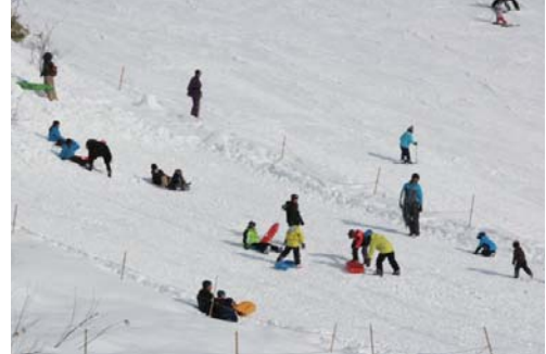
大人も楽しんでいるソリコース ソリは無料で貸してもらえます

キーヤーとは仕切られているため、安全に練習できます。その他、小さなお子さん等の気分転換に利用されているソリコースもあります。