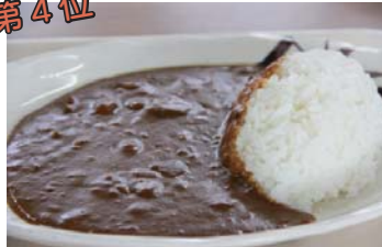
ビーフカレーライス