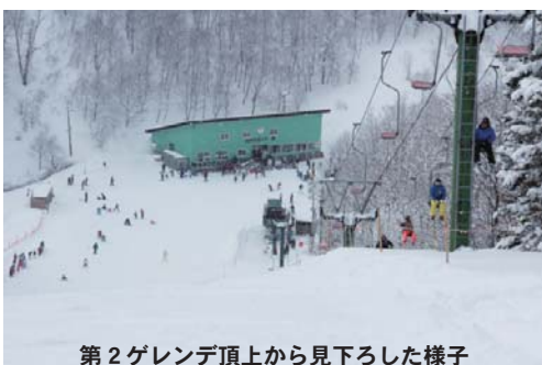
第2ゲレンデ頂上から見下ろした様子