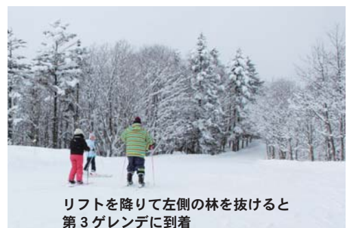
リフトを降りて左側の林を抜けると第3ゲレンデに到着