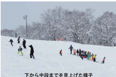
下から中段までを見上げた様子