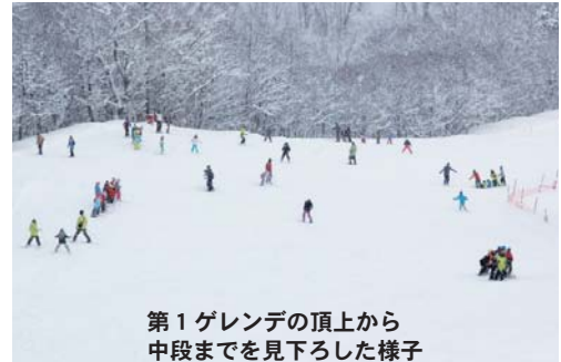
第1ゲレンデの頂上から中段までを見下ろした様子