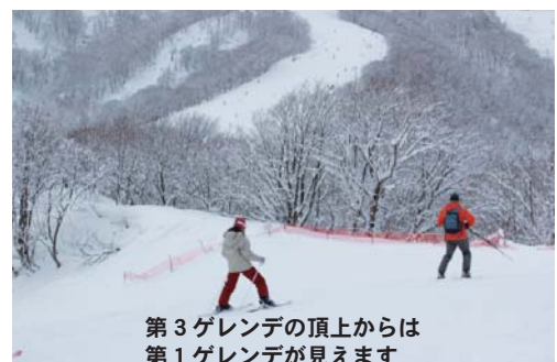
第3ゲレンデの頂上からは第1ゲレンデが見えます