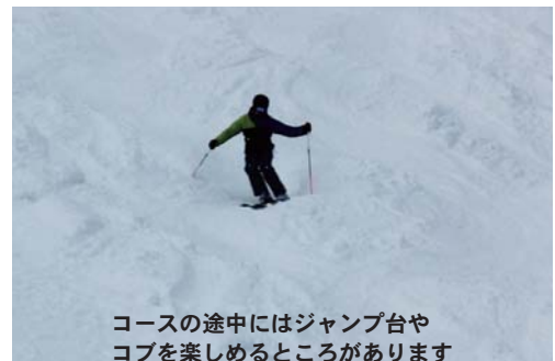
コースの途中にはジャンプ台やコブを楽しめるところがあります