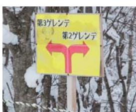
リフトを降りた正面には案内標識が！！