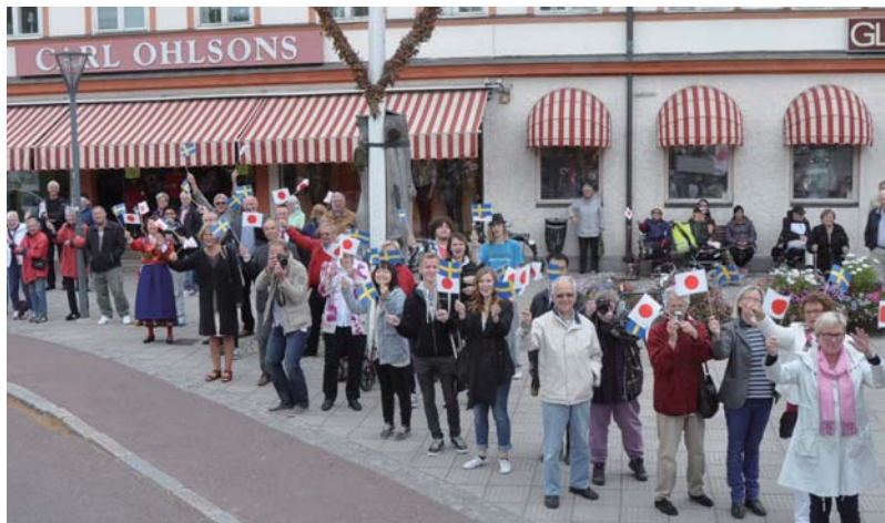
レクサンド市民の熱烈なお出迎え