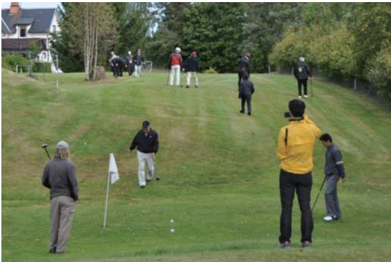
姉妹都市 25 周年記念事業時 (平成 24 年 9 月) のパークゴルフの様子

当別町からレクサンド市へパークゴルフ用具を贈呈したことをきっかけに、ヨーロッパ第 1 号のパークゴルフコースがレクサンド市のインシヨンに開設されました。コースは全部で 9 ホールです。