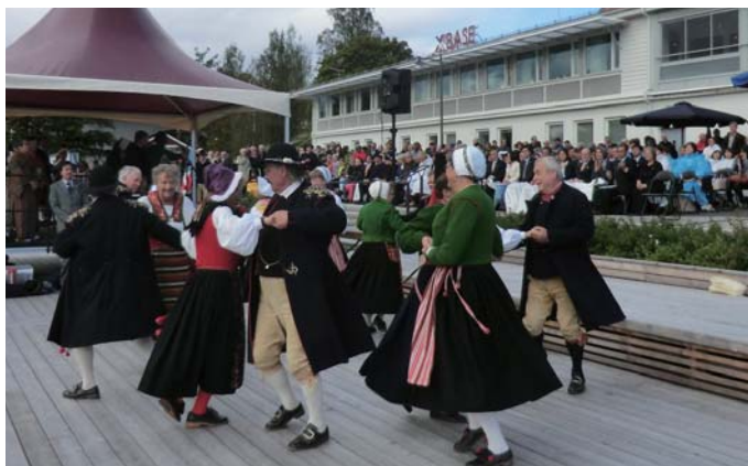
記念式典でのダンス披露