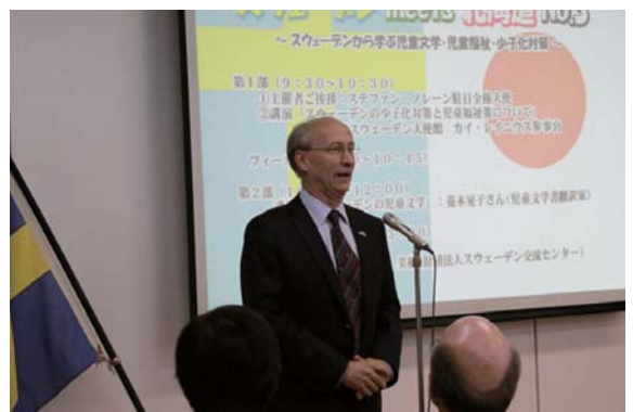
スウェーデン meets 北海道で挨拶するステファン・ノレーン大使