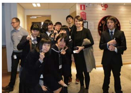
ウルリカ市長との記念写真

これまで主にアメリカへの派遣が多かった「高校生の短期留学ホームステイ事業」をレクサンド市にて 5 日間行い、語学研修だけではなく、青少年の交流機会を増やすことができました。