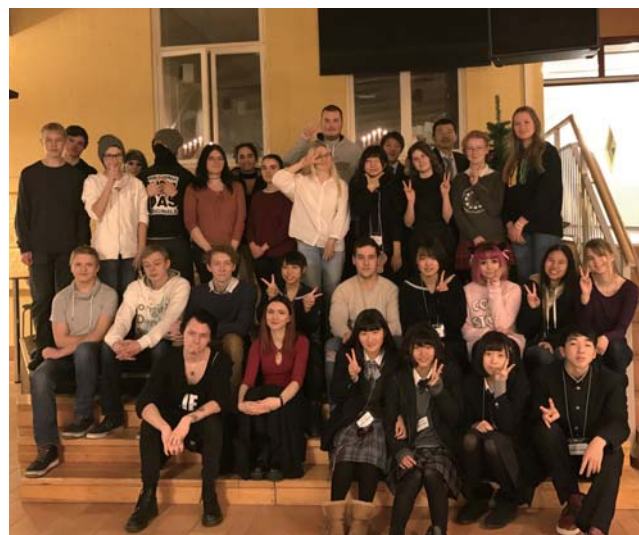
レクサンド高校の生徒との記念写真