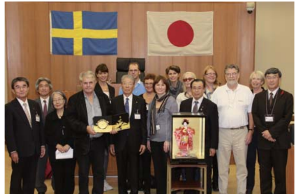
レクサンド市からの訪問団員が町を表敬

当別町 140 年記念式典に参加のためレクサンド市から 11 人が来町しました。式典のほか、民族衣装でのパレードやパークゴルフ大会、スウェーデン大使館主催のプロモーションイベントの「スウェーデン meets 北海道」も記念事業として開催されました。