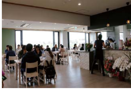
カフェ テルツィーナ