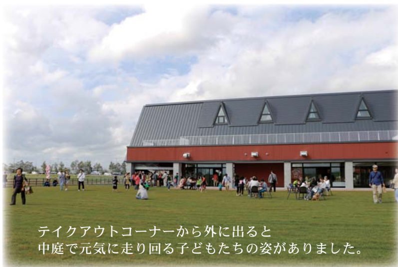
オープン前の正面入口の様子

9月23日・24日の開業時には 大勢の方にお越しいただきありがとうございました。 大変なご好評をいただき 入場するまでにかなりの待ち時間をいただいたこと 深くお詫び申し上げます。 しばらくは週末の混雑が予想され ご不便をおかけしますが、 当別の魅力と美味しさを 発信していきます。 未永くよろしくお願ひ申し上げます。