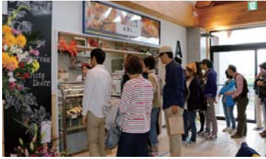
レストラン アリ Ari