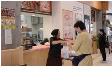
スマイルキッチン (田西会館・浅野農場)