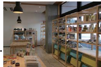
トーベスト ショップ TOBEST SHOP (地域特産品コーナー)