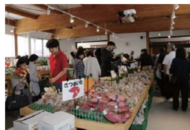
はなポケ道の駅店