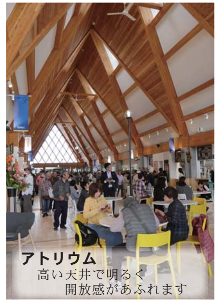
アトリウム 高い天井で明るく 開放感があふれます