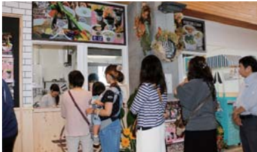
高陣 カップ ストア CUP STORE