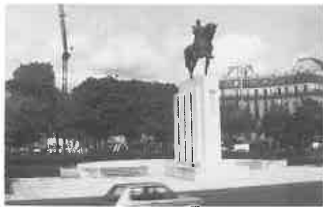
パリのコンコルド広場

●少ない日本への理解と認識 私達を暖かく迎えてくれたホストファミリーは日本への関心も特に高いはずなのに、日本語は全く通じなく、まして一般の市民は、日本が何処にあるかも知らない人が多く、私がカナダで行った日本への知識度アンケートで「君達は私達を試しているのか」と怒られる一コマもありました。