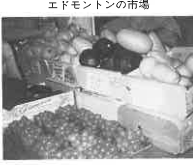
エドモントンの市場

彼らの得ている日本の知識は、フジヤマ・ゲイシャ・チョンマゲの時代錯誤したものとホンダ・トヨタ・ソニーの経済的な側面だけのようです。その反面、禅、武士道のような精神的文化に対しては私達以上に関心を示します。私達は日本の素顔を相手に理解してもらおうことの必要性を深く感じました。