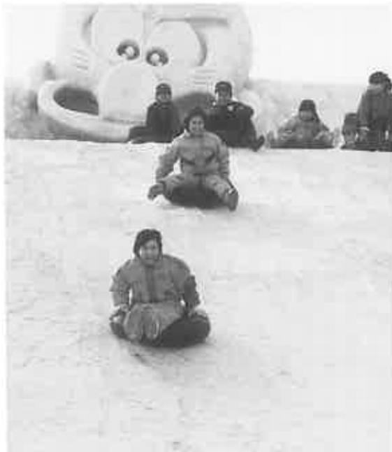
▲スピードあるチューブ滑り

また、会場には飲食店組合や消費者協会による、うどんやイモ天などの店も並び、訪れた家族連れがおいしい味に舌づつみをうっていました。14日は、もちまきや青山小学校と札幌創成小学校との交流学習会も行われ、初めて当別を訪れた創成小学校の子供たちもゲームなどで楽しい一日を過ごしていました。