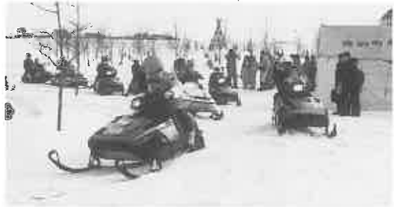
▼豪快なスノーモビル

18日からは、スノーモビルや雪上車試乗会が始まり、会場は、長い列ができるほどの人気で、ヘルメット姿でスノーモビルに乗り込む子供たちからは、歓声が上がっていました。