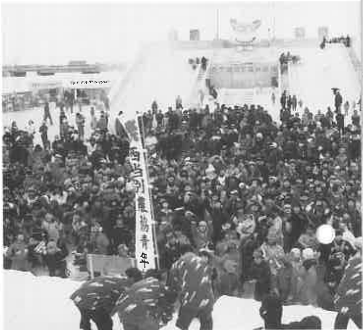
▲もちまきには人の波ができました