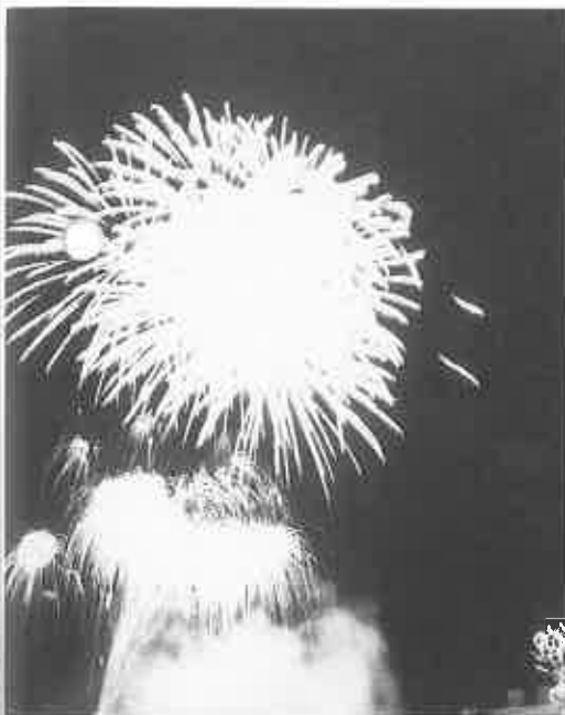
▲夜空を彩った冬の花火

ろ」をかたどった高さ12メートルの滑り台付き雪像や「ベビークイーンシー」「うさぎとかめ」「ドラゴンボール」など、テレビの人気者や童話に登場する動物の雪像のほか、大小18基が見事に出来上がりしました。