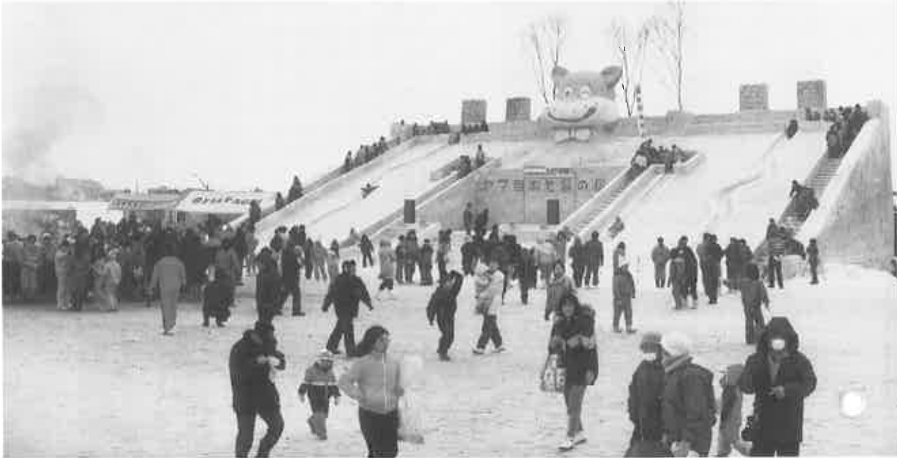
▲メインステージの「のらくろの滑り台」は高さ12メートル幅30メートルの大雪像

今年も「親子のふれ合いを求めて」をテーマに、会場にはマンガの主人公「のらくろ」の滑り台