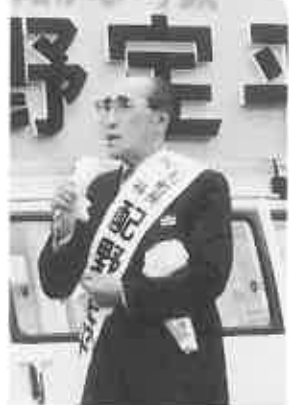
前に別別駅裏と駅前道路を整備を早急に図りたい考えを示しました。

札幌大橋の開通（昨年8月）によって札幌市との距離が一挙に縮まったことで、都市化の波が押し寄せて来ることは時間の問題、都市と農村とが調和した発展を目指すためにも、町総合開発計画、土地利用計画などの見直しを図り、将来人口の増、農業