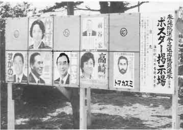
▲公営掲示板にはり出された立候補者のポスター