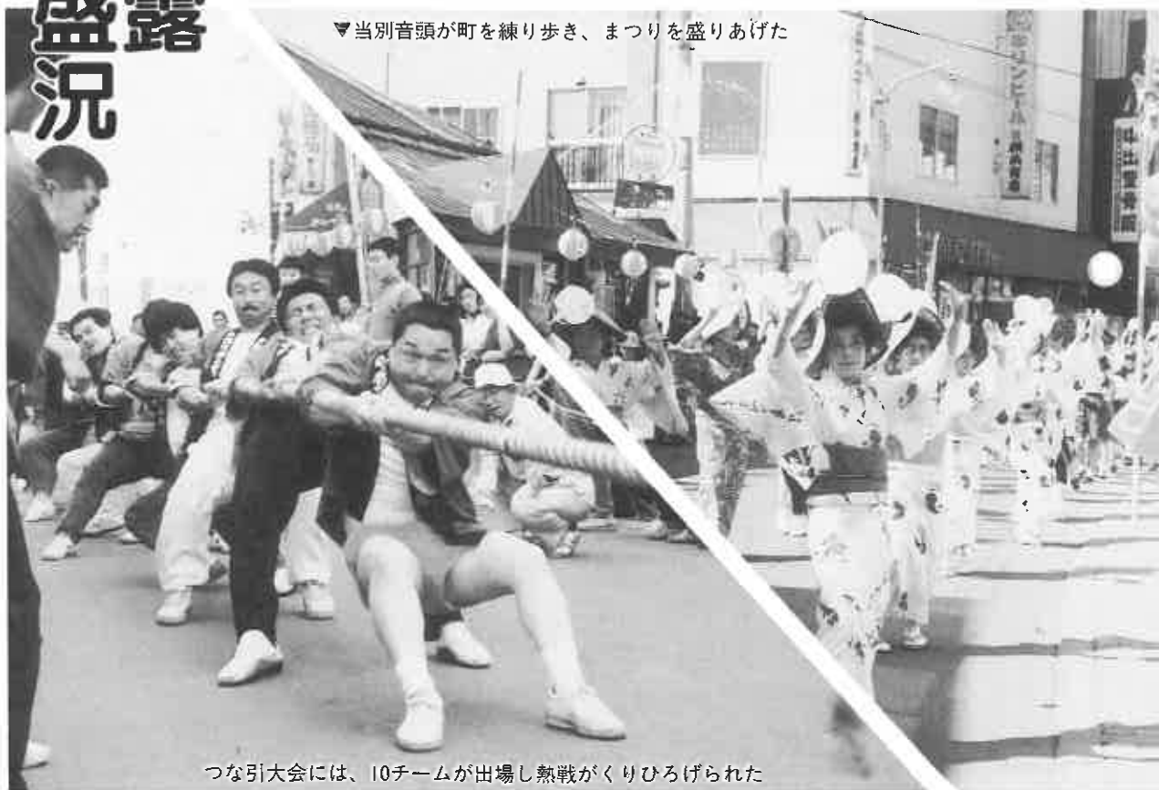
つな引大会には、10チームが出場し熱戦がくりひろげられた