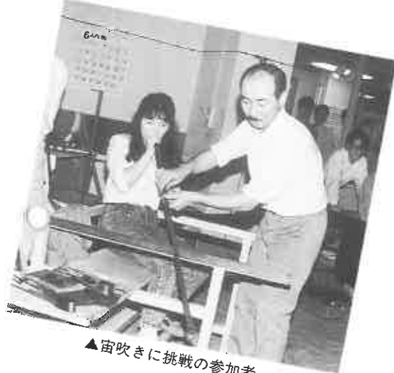
▲宙吹きに挑戦の参加者

夏至祭は、夏の短いスウェーデンで一年中で昼が最も長い日に、太陽の恵みと豊作などを祈る祭り。今年で6回目をむかえた夏至祭は、スウェーデンでも最も盛んな地方とされています。