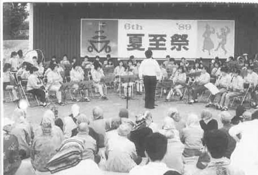
▲当別中学校吹奏学部によるグリーンコンサートで夏至祭が開幕

スウェーデンとの交流を深めようと、獅子内のスウェーデン交流センターで、6月25日、日本で唯一といわれる「夏至祭」が、また、7月16日・17日の両日地場産業の活性化を図ろうと、本通商店街の歩行者天