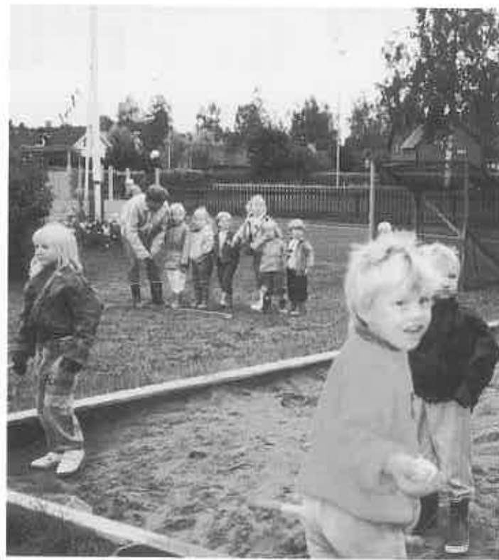
▲広い敷地の保育所、日本と同じように砂の遊び場もあります

65歳以上のお年寄りと身体に障害がある方が3、856人と人口の約27%にもなるそうです。そのうち85歳以上が306人ということで、高齢化社会は当別以上の様です。ホームは、個室が65で8畳ぐらいの部屋に家具が置かれ、室内は写真や花が飾られていました。食事はメニューも多く、献