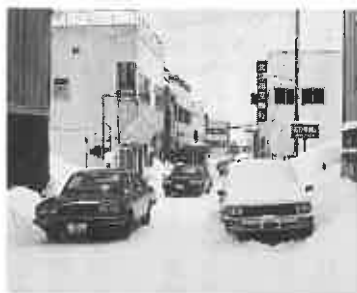
路上駐車は迷惑です