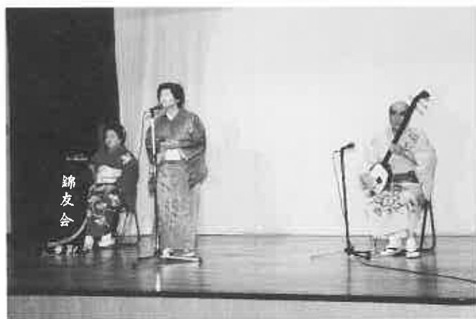
▲自慢ののどを披露する芸能発表会