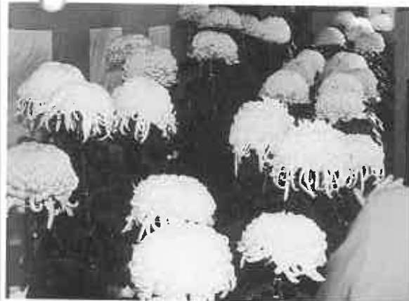
▲丹精込めて育てた大輪の菊