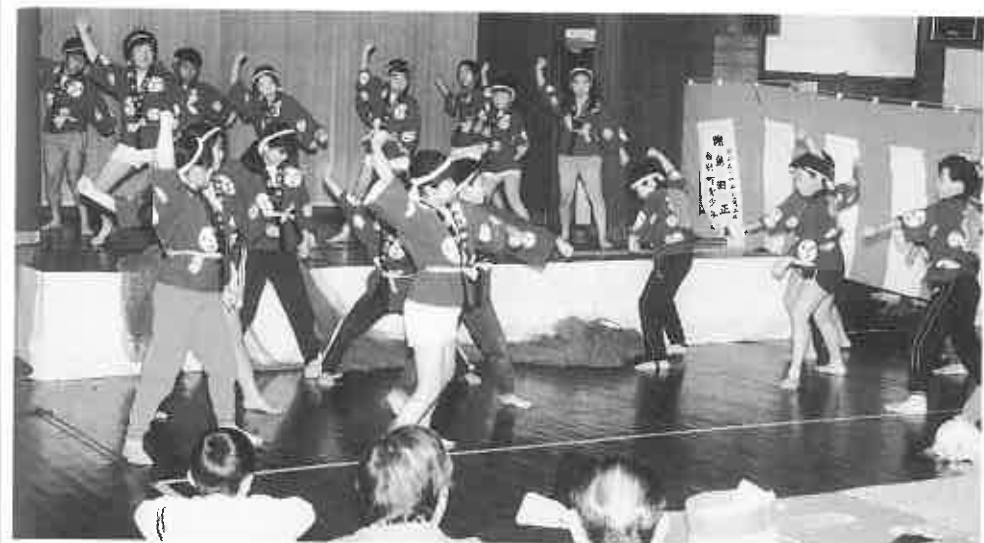
▲西当別小学校5年生の元気いっぱいのソーラン節