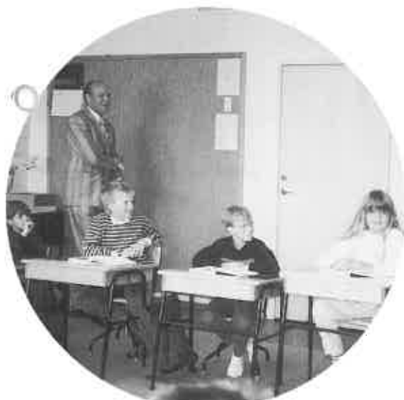
▲レクサンド市の子供たちの表情は明るい