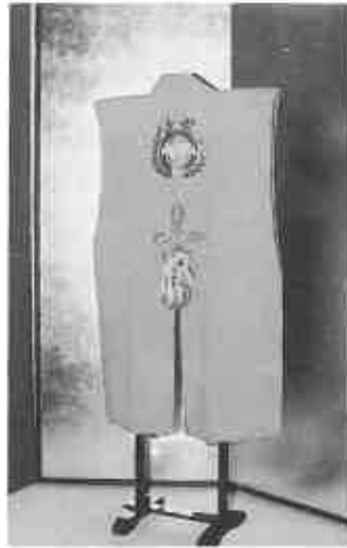
陣羽織(上)と火事装束