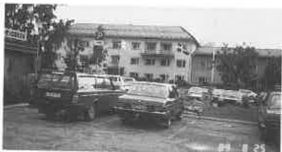
▲レクサンド市庁舎には日の丸の旗も掲げられた