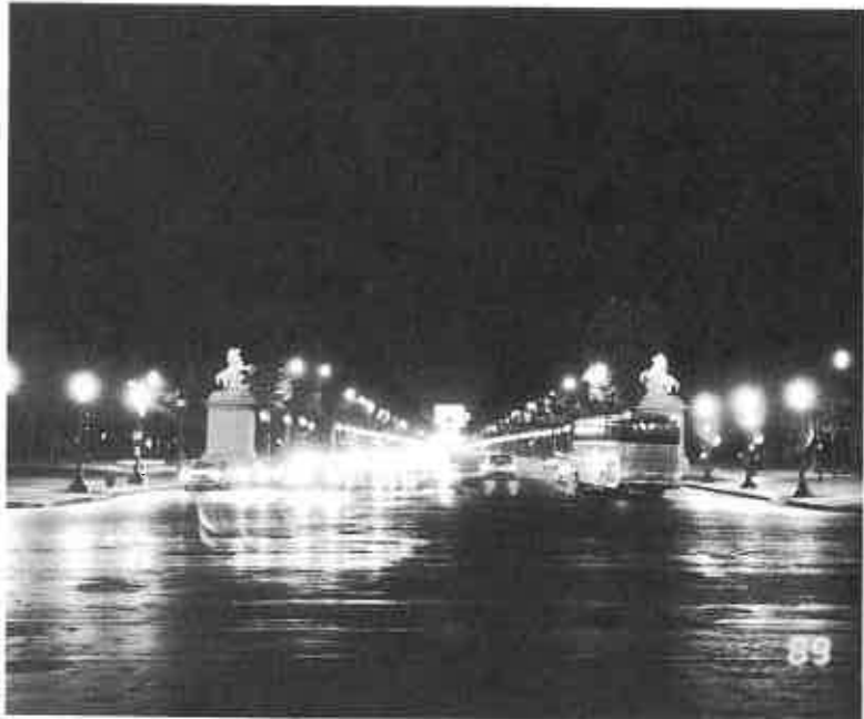
▲シャンゼリ大通りの夜景は素晴らしい

16時38分、途中2カ所の駅に停車しただけでTGVはバカンス帰りで混雑しているリヨン駅に着きました。