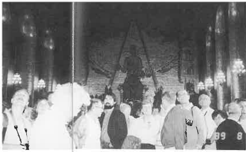
▲ストックホルム市庁舎の黄金の間は世界中の観光客でにぎわう