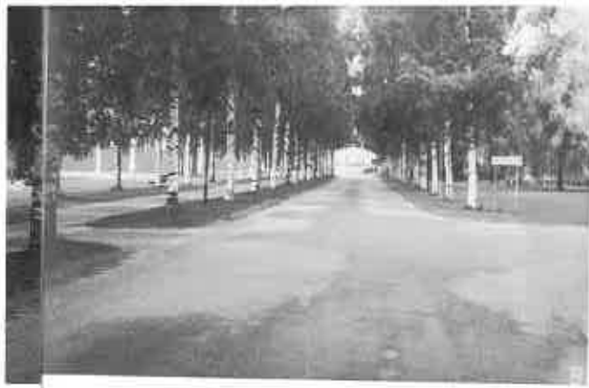
▲レクサンド市は緑が多く、街路樹に白樺も