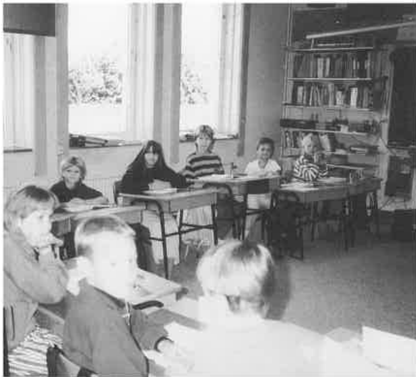
▲小学校の授業のようす

8時25分スイス航空機でチューリヒに向かいます。眼下に豊かな耕地が広がるのを見ながら、10時55分ごろスイスの東玄関チューリヒのクローテン空港に着きました。