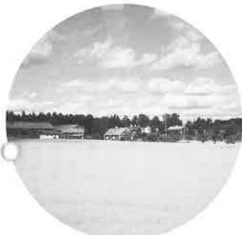
▲麦畑の田園風景は当別に似ている

最初に市庁舎を見学。赤っぽいレンガの壁、柱と床は大石が多く使われており、歴史的建造物が今なお庄重なたたずまいを見せています。また「黄金の間」で行われるノーベル賞受賞祝賀パーティ会場は、壁一面が金箔に覆われ、訪れる人を圧倒するかのようです。また、旧市街地の家並みは、中世の建物がまだそのまま保存されており、その姿が湖面に美しく映し出されています。