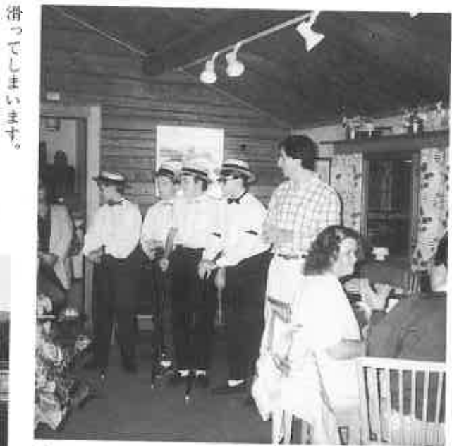
▲昨年の少年野球大会で東京に来たレクサンドチームの子供たちが歌を披露し歓迎