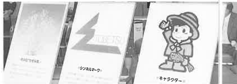
新しい顔のキャラクターとシンボルマーク、町の花「かすみ草」