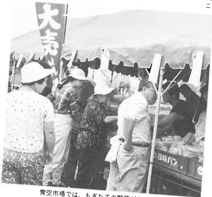
青空市場では、もぎたての野菜がならんだ