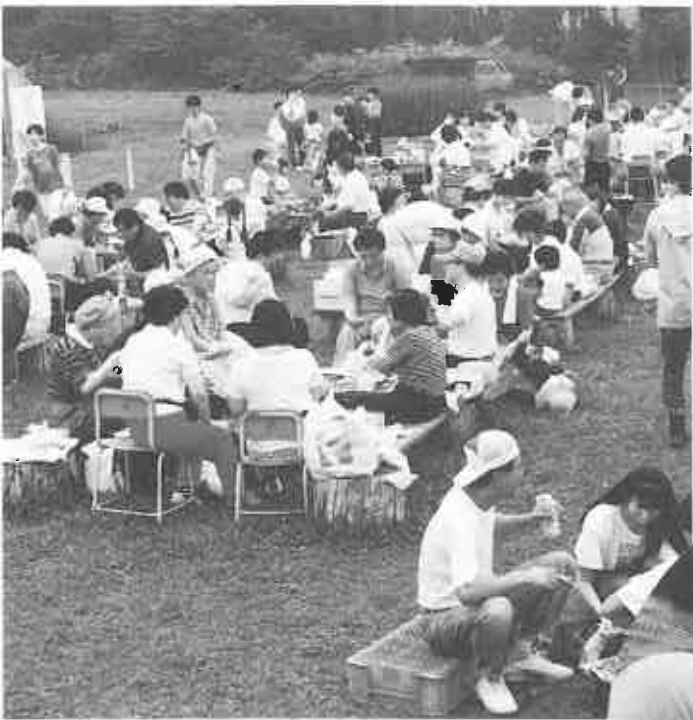
「ウーン格別」いも掘りの後は 弁当を広げてジンギス汗

ジンギス汗コーナーでは、持参した弁当をひろげ、ジンギス汗やもぎたてのトウキビを食べたり、また子供たちはヨーヨーつりやうさぎ小屋に入り、うさぎを抱いたり、手で触れるなどして、自然とのふれあいの中で、味覚の秋の一日を思いっきり楽しんでいました。