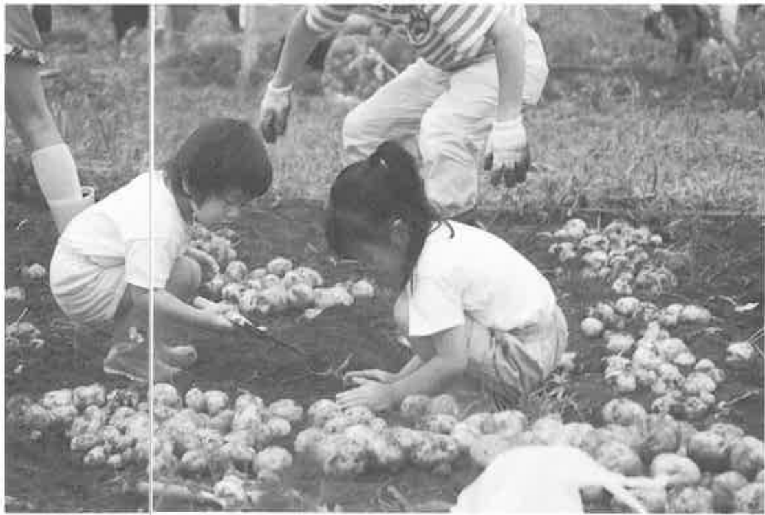
「こんなにたくさんのイモ、食べられるかな」