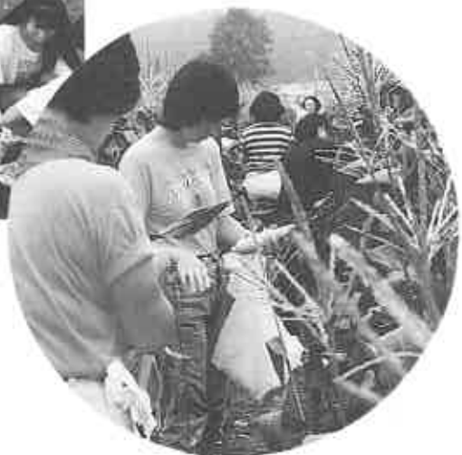
トウキビ畑でもぎとり。 これが本当の「産地直送」

今年も4月から募集したところ札幌市民を中心に284家族の申込みがあり、1区画（13平方メートル）4,500円（町内者3,500円）を払って、5月から種イモ植え、土寄せ、草刈りなどの手入れをし、収穫を楽しみにしていました。 この日は、朝早くから農園主らが、クワやスコップを手に、土まみれになりながら、ころころと掘り出されるジャガイモに歓声をあげながら、大きな袋につめていました。 今年のジャガイモの作柄は、春からの天候に恵まれ、1区画から40〜50キも穫れる豊作で、農園主も袋につめこ