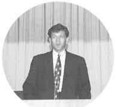
会場を笑わせたケント・ギルバート氏