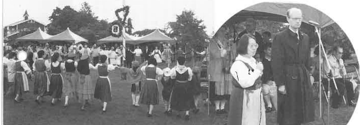
マイストングを囲んでのフォークダンス