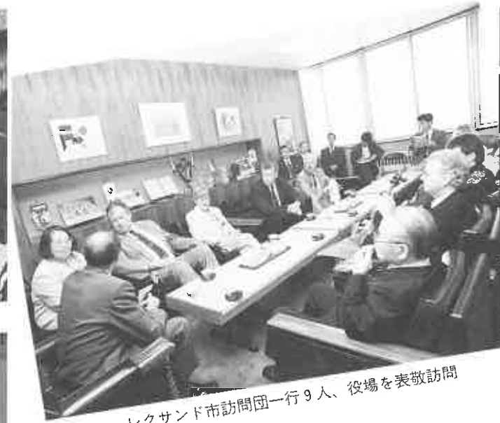
レクサンド市訪問団一行9人、役場を表敬訪問