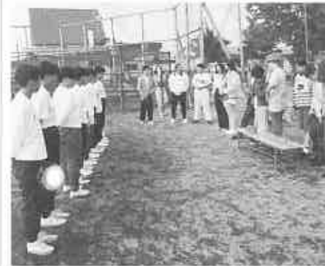
当高ソフト部とソフトで交歓