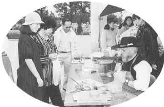
スウェーデンの伝統的絵模様の実演会も……