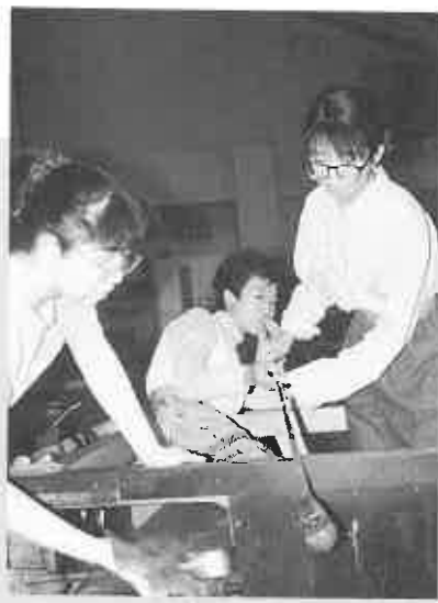
形を作るのが難しいガラス制作体験

ンド演奏や、午後4時30分から始まった「スウェーデン・民族音楽の夕べ」では、米町のヴァイオリン演奏家4人が「レクサンド・メロデー」などを演奏と歌で披露、感動の拍手を受けていました。また、午後1時と5時30分から総合体育館で開かれた「バラエティショー」では、当別町出身の落語家「柳亭小痴楽」のほか「林家木久蔵」らが出演、延べ約1,200人が詰め掛けた会場は、笑い声で一杯でした。