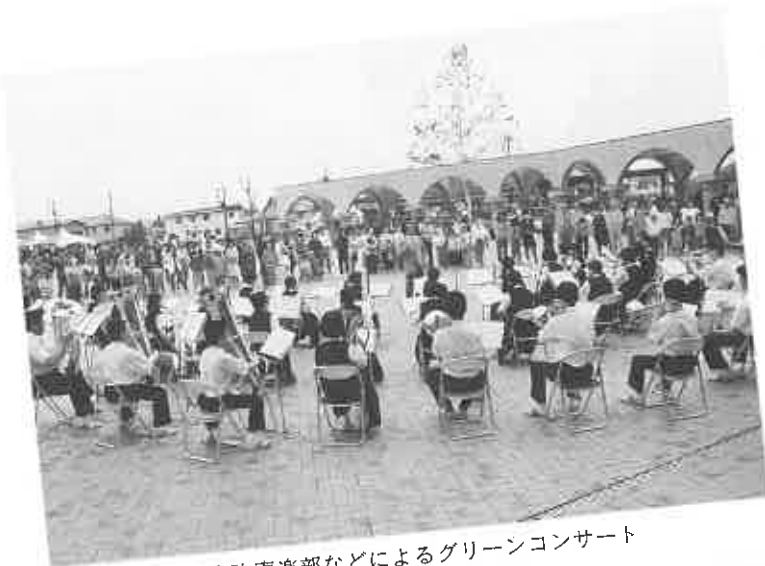
当中吹奏楽部などによるグリーンコンサート