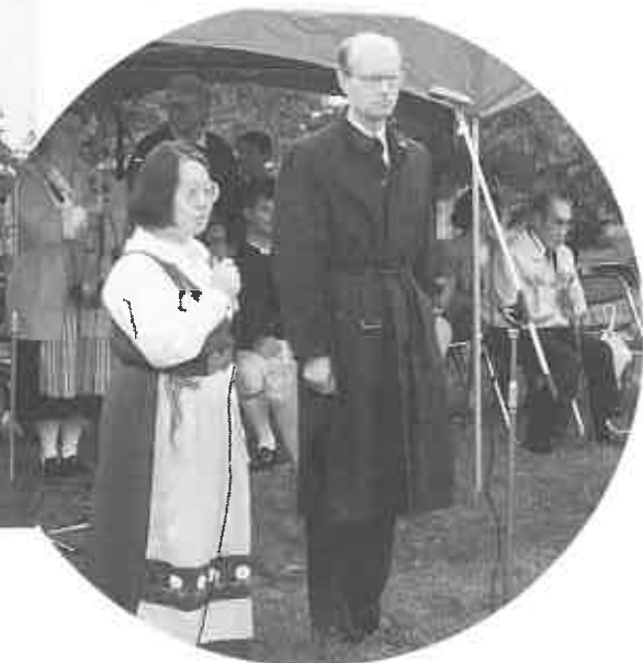
両会場にはマグヌス駐日スウェーデン大使も訪れた