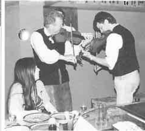
演奏はどこでも歓迎された