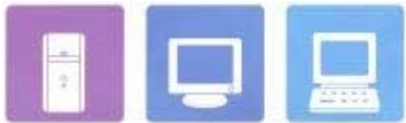
デスクトップパソコン本体 ディスプレイ（ブラウン管・液晶） ノート型パソコン

※パソコンと一体で販売されたキーボード・マウス・ケーブルなどの付属品は、パソコンと一緒に出した場合、回収します。