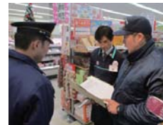
店舗での 防火査察