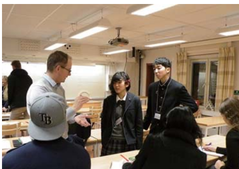
レクサンド高校での理科の授業