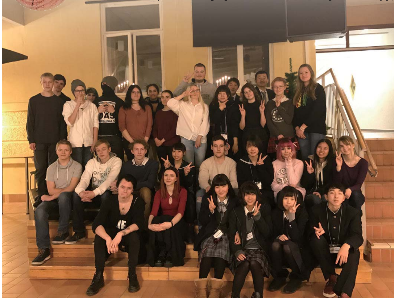
レクサンド高校校舎内にて

当別町ではまちづくりを担う人材を育成する「当別町人材育成基金」を設けています。この基金を活用した事業の一つに高校生の短期留学ホームステイ研修事業があり、これまで異文化の体験や語学習得を目的としてアメリカ、カナダなどへの研修事業を実施してきましたが、平成27年度から研修先を姉妹都市であるスウェーデン王国レクサンド市へ切