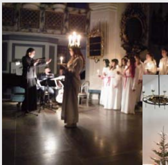
レクサンド教会 ロシアコンサート