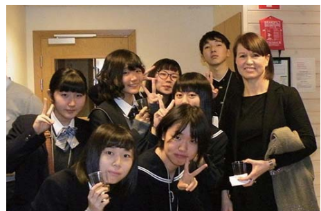
ウルリカ市長（右端）と記念撮影