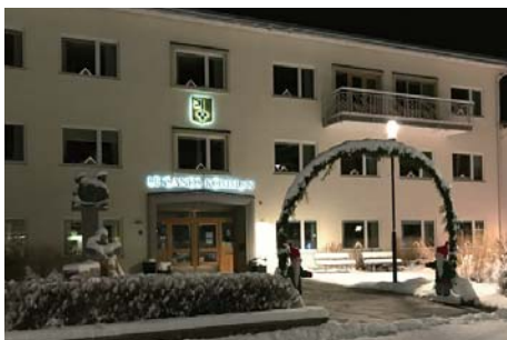
夜のレクサンド市庁舎