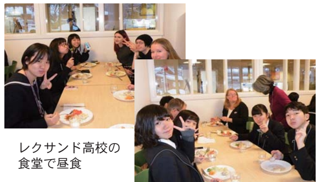
レクサンド高校の 食堂で昼食