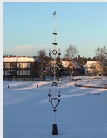
長さ 20 m 以上の マイストングは 当別の約 2 倍の長さ