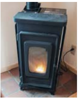
木質ペレットを 燃料とする ペレットストーブ

セミナーでは、町内の「未利用木材」や「生ごみや食品残渣」などの未利用バイオマスの利活用方法や、バイオマスの地域循環によって生まれる経済効果などを解説します。参加料は無料！