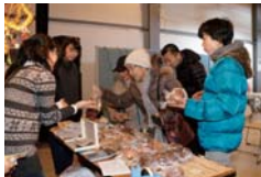
昨年初開催のパンまつり