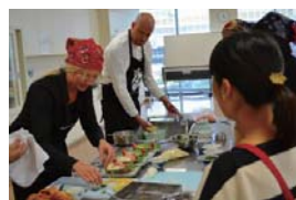
料理講習会の様子

この事業によって、スウェーデン文化の理解を深め、国際交流の一助を担うことができました。