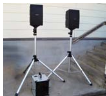
整備された備品の一部

今後は、町内会のコミュニティ活動である夏祭りや福祉事業の食事会など、町内会活動の一層の発展に寄与することが期待されます。