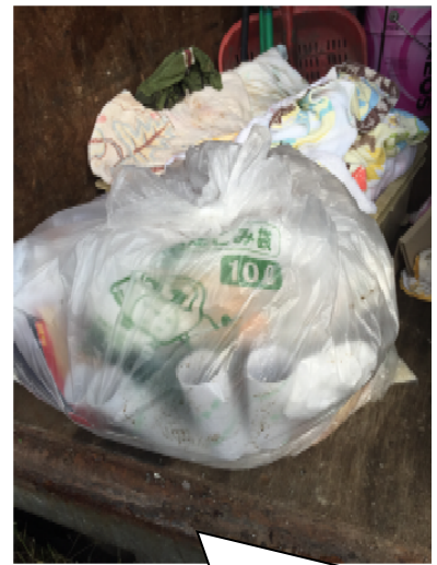
指定ではない袋(約45L)に10Lの指定ごみ袋が入れてある