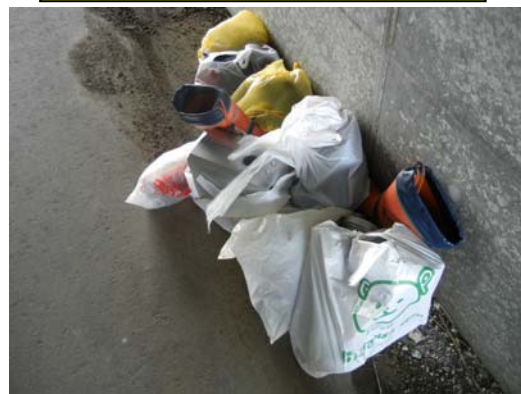
今年度にあった不法投棄の一部

また、私有地への不法投棄は、土地や建物の所有者・管理者が処理しなければなりません。不法投棄をさせないためにも、人が立ち入れないように囲いを設けるなど、日ごろから土地の管理には十分注意してください。