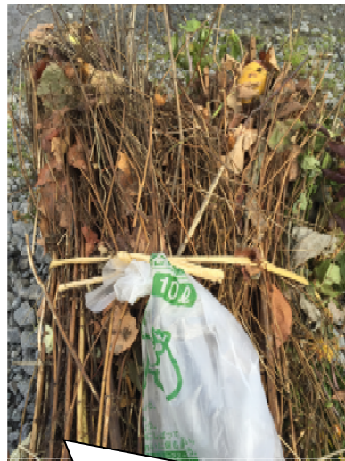
枯草等に大きさが見合わない10Lの指定袋を縛り付けてある