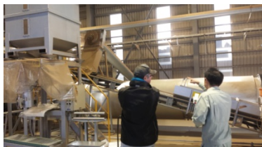
先進地視察状況(群馬県上野村)